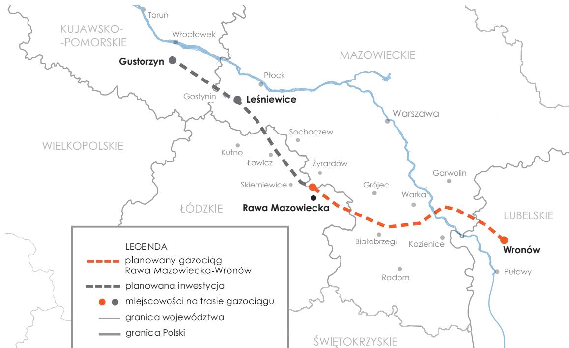
Schematyczna mapa poglądowa.